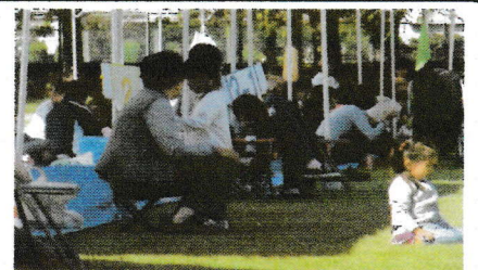
応援どころか!孫の子守で大変よ?

「小島南ふれあい運動会」が10月16日(日)沖電気グラウンドで、大勢の方に参加して頂き盛大に開催しました。また、当日は晴天のもと芝生のフィールド内で、ご家族等の応援頂いて選手の皆さん頑張っていました。とても楽しい一日でした。