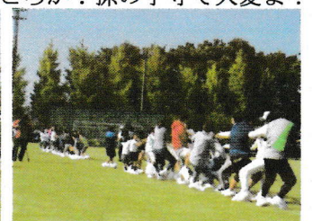
生玉子割らずに受け止めて!滑らず力あわせて引張って