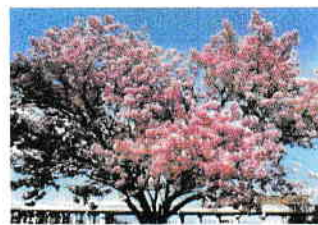
本庄市いまい台の桜