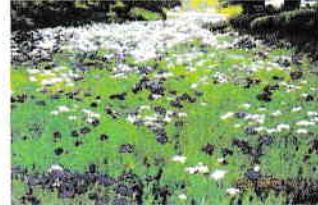
伊勢崎赤堀の菖蒲