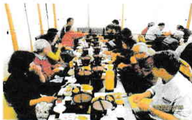
皆さん今年も宜しく

新元号初めての新年会を29名の参加者を頂いて2月5日(水)に「かんなの湯」で開催いたしました。